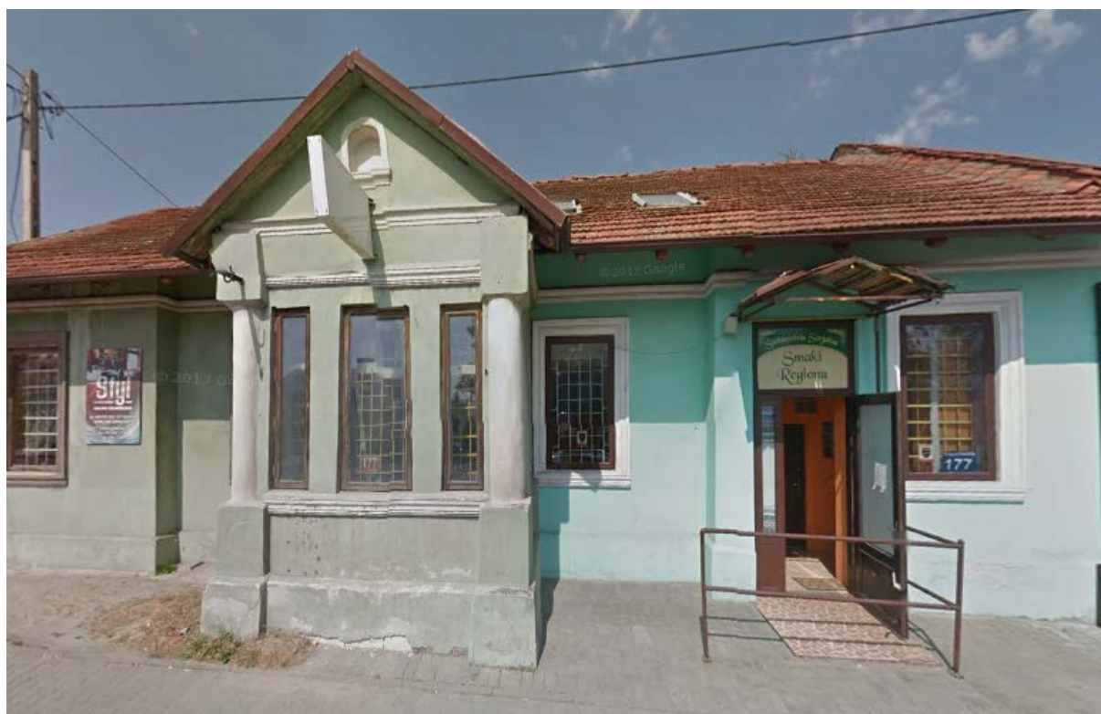
Rys. 2. Zdjęcie frontu budynku w którym mieściła się siedziba i punkt gastronomiczny Spółdzielni Socjalnej Smaki Regionu (fot. sierpień 2013 r.). 83